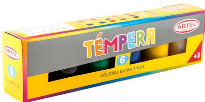
Imagen sólo referencial