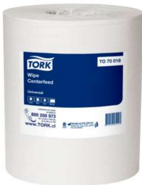
FOTO DE PRODUCTO